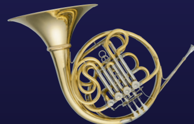
LD-X5 Anniversary ¥1,705,000

LD-X5は、クリアな発音、オープンなサウンドを得ることができるモデル。ルイスの持つ伝統的なデザインを残しつつも、国境を越えた二人のマイスターが共同開発したこのモデルは、その比類なき性能により、奏者に最高のクオリティを持って応える楽器となりました。