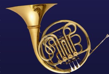
205YBL “Weimar Belrin” ¥1,485,000

この205シリーズは、20世紀初頭のC.F. Schmidtによる“Weimar-Berlin”からインスピレーションを受けて設計されました。ベル部分はオットー社によるオリジナル。C.F. Schmidtを基に設計されたマウスパイプは、音程の改善とさらなる音色の追求によって、エッカー氏のカスタマイズがなされています。オットー社の他のモデルと違い、マウスパイプ以外、本体のほとんどがイエローブラスになっており、さらに輝かしく、深みのある柔らかい音を実現。Carl Geyerにヒントを得た抜差管もイエローブラスで製作されています。マウスパイプとベル銅部分は、支柱を使わず、直接接合などのこだわりにご注目ください。必要な支柱は、自社製作によるハンドハンマリングにより、一つ一つのホルンに合わせて作られ、調整されているものこだわりの部分です。