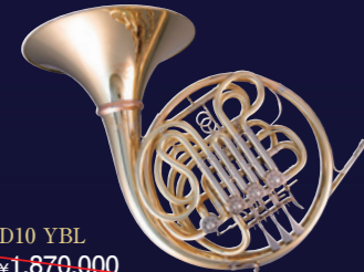
D10 YBL ¥1,870,000