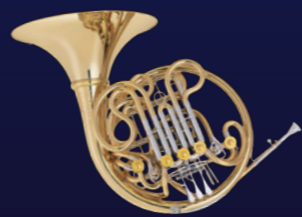
フルトリプルYBL High Eb コンパクト ¥2,695,000

シュミットホルンの代名詞ともいえるHigh Eb管。今回はフルトリプルホルンBb/F/High Ebをご紹介します。ホルンを演奏する上で切っても切れない関係の調整“Eb”。シュミットのHigh Eb管はオーケストラで、ソロで、様々な場面で奏者を助けられます。High F管より構造上マウスパイプが長くとれる為、息の流れの感覚もフルダブルに似ており、フルダブルからの移行もスムーズです。是非一度お試しください。