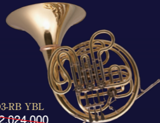
D3 RB YBL ¥2,024,000