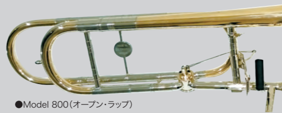
●Model 800 (オープン・ラップ)

短所とされる様々な部分の改良に努め、1996年に独自のモデルの開発を始めました。中でも自信作となったのは、2年後に完成したテナーバス