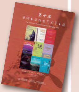
第10回アジア・フルーツコンgress 2019上海のプログラム