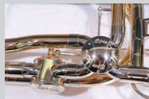
●オープンフロー・ヴァルブ

ヤンはフレツツイナーの定評ある美しいサウンドを残すだけでなく、音程や操作性などドイツ・トロンボーン