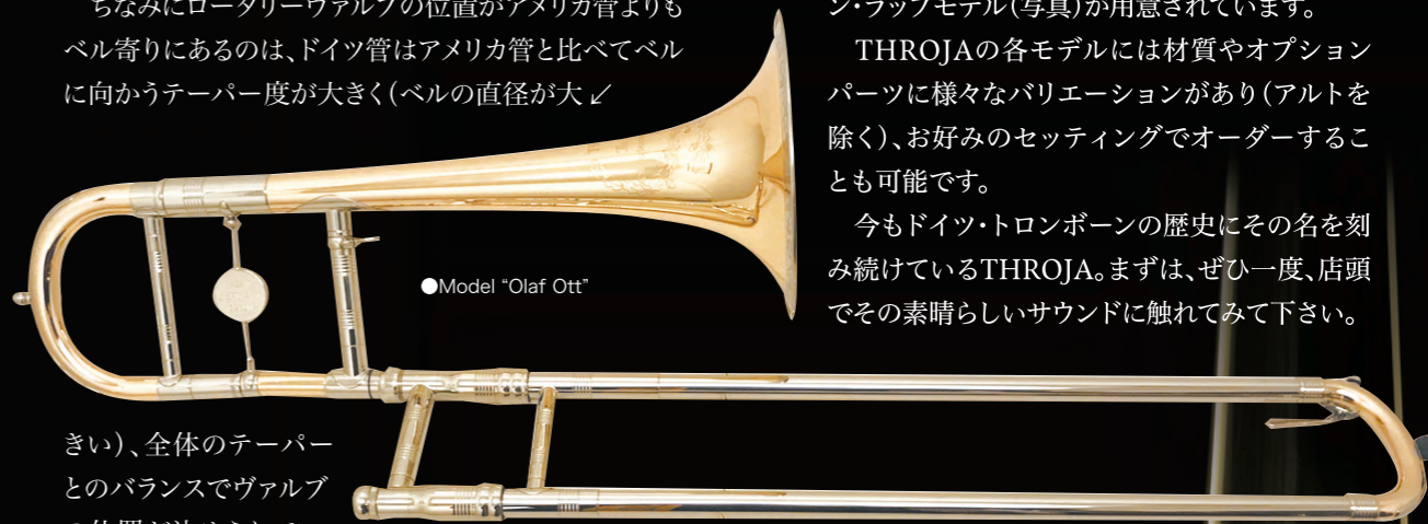
●Model "Olaf Ott"

ちなみにロータリーヴァルブの位置がアメリカ管よりもベル寄りにあるのは、ドイツ管はアメリカ管と比べてベルに向かうテーパー度が大きく(ベルの直径が大