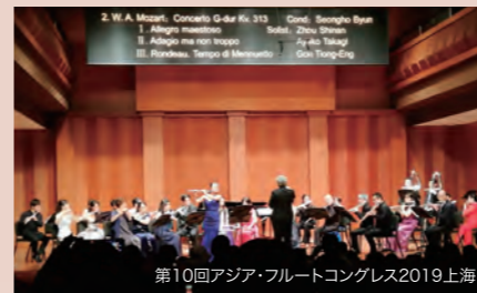
第10回アジア・フルーツコンgress2019上海