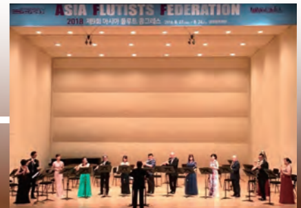
第9回 アジア・フルーツコンgress 釜山2018