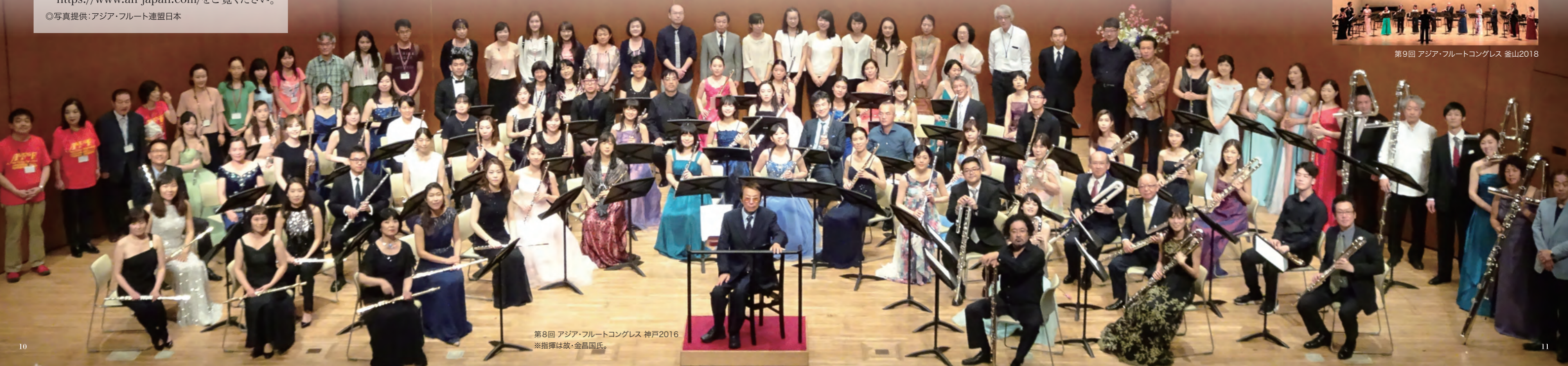
第8回 アジア・フルーツコンgress 神戸2016 ※指揮は故・金昌国氏。