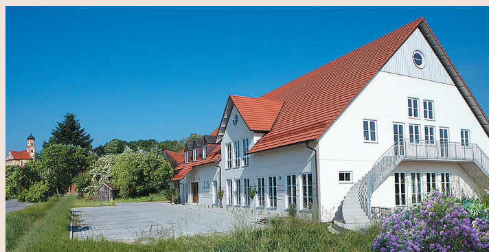
エンゲルベルト・シュミット社 工房外観