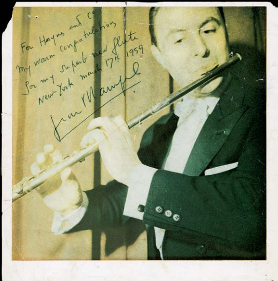
生涯ヘインズフルートを愛したJ-P.ランパル

QUITE SIMPLY, THE MOST BEAUTIFUL FLUTE IN THE WORLD.